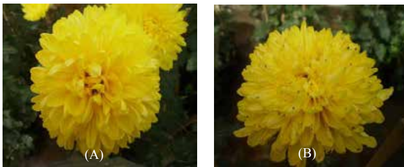
Gambar 3. (A) bunga sehat ( healthy flower ), (B) bunga terserang M. sanborni ( flower attacked by M. sanborni )

Hasil penelitian menunjukkan bahwa aplikasi bioinsektisida berpengaruh nyata dalam menekan perkembangan populasi dan meningkatkan mortalitas kutudaun pada tanaman krisan. Kemampuan tersebut diduga berkaitan erat dengan kemampuan patogenisitas B. bassiana dalam memarasit kutudaun (virulensi), konsentrasi, bahan pembawa, dan waktu aplikasi. Virulensi cendawan erat kaitannya dengan jumlah enzim dan toksin yang diproduksi cendawan pada proses infeksi (Tanada dan Kaya 1993, Alves 1998 dalam Sassa et al. 2009). Konsentrasi B. bassiana pada Biorama 1, 2, dan 3 yang digunakan cukup efektif dalam menekan populasi kutudaun. Meskipun menurut hasil uji statistik tidak menunjukkan perbedaan tetapi penambahan carrier cenderung meningkatkan efektivitas B. bassiana . Hal itu