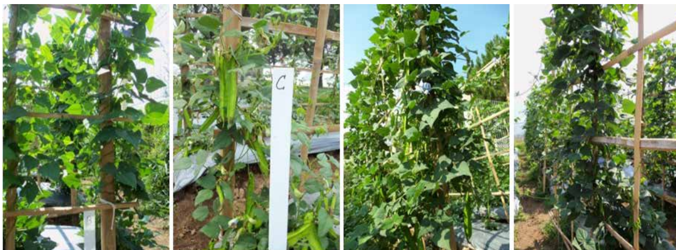
Gambar 3. Penampilan beberapa nomor kecipir di lapangan yang memperlihatkan perbedaan pertumbuhan dan produksi polong (kiri ke kanan: KCP B, KCP C, KCP D, dan KCP E) [Performance of some numbers winged bean showed the difference in growth and pod production (left to right: KCP B, KCP C, KCP D, and KCP E)]

Kandungan serat ini dianalisis dari polong muda segar fase konsumsi ( tender pod ). Keterlambatan panen akan menyebabkan kandungan serat meningkat. Claydon (1983) dan Ningombam et al. (2012) menyatakan bahwa tingkat kematangan bagian-bagian edibel dari tanaman kecipir, terutama polong, berpengaruh terhadap peningkatan kandungan protein, serat, dan lemak.