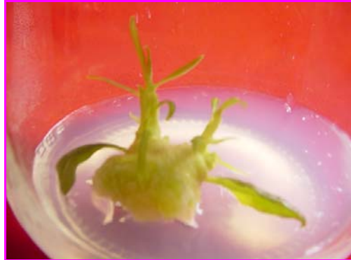
Gambar 2. Pembentukan kalus pada pangkal tunas pada media MS + BA 5 mg/l.

Hal ini sesuai dengan mikropropagasi pada cendana yang menggunakan buku dengan daun untuk perbanyakannya (Minh dan Thu 2001).