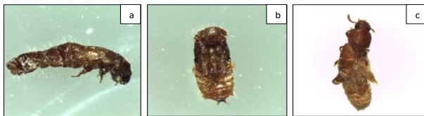
Gambar 1. Gejala abnormal pada T. castaneum setelah perlakuan dengan fraksi aktif minyak peppermint M. piperita ; (a) larva gagal menjadi pupa, (b) pupa gagal menjadi imago, (c) imago abnormal.

Angka yang diikuti huruf yang sama pada kolom yang sama menyatakan tidak berbeda nyata menurut DMRT 5 %/Numbers followed by same letter in the same column were not significantly different by 5% DMRT.