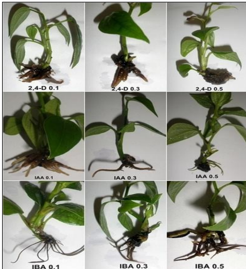
Gambar 2. Induksi perakaran lada secara in vitro pada beberapa perlakuan auksin Figure 2. Induction in vitro of root black pepper on some auxin treatment

Keterangan : Angka yang diikuti oleh huruf yang sama pada kolom yang sama tidak berbeda nyata pada uji Tukey taraf 5% Notes : Numbers followed by the same letter at the column are not significantly different according to Tukey test at 5% level