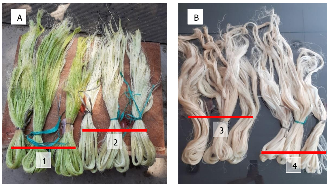
Gambar 2. A. Serat basah : Sistem dekortikasi kering (1), Sistem dekortikasi basah (2) B. Serat kering : Sistem dekortikasi kering (3), Sistem dekortikasi basah (4)

Dekortikasi sistem kering menghasilkan serat basah dengan warna sedikit kehijau-hijauan bila dibandingkan dengan serat yang dihasilkan dengan sistem basah (Gambar 2). Warna kehijau-hijauan yang disebabkan oleh warna hijau daun tersebut terlihat sedikit berpengaruh terhadap kecerahan warna serat setelah dikeringkan. Warna serat hasil sistem basah sedikit lebih cerah dibanding hasil serat sistem kering. Sedikit perbedaan warna tersebut diperkirakan akan berpengaruh jika pemanfaatan serat sisal tersebut untuk benang tekstil. Namun jika digunakan untuk produk industri lainnya, sedikit perbedaan warna tersebut kurang berpengaruh terhadap mutu