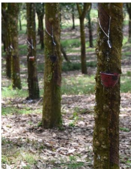
Gambar 3. Penyadapan ganda ( double cut ) pada klon slow starter

Kondisi fisiologis tanaman dapat dipantau melalui diagnosis lateks (Adou et al. , 2018). Metode ini mengukur aktivitas metabolisme tanaman melalui kadar sukrosa, fosfat anorganik dan tiol dari lateks (Herlinawati dan Kuswanhadi, 2013). Kadar sukrosa menunjukkan tingkat ketersediaan bahan baku untuk biosintesis partikel karet. Fosfat anorganik (Fa) menunjukkan potensi tanaman untuk mengubah bahan baku sukrosa menjadi partikel karet, sedangkan kadar tiol menunjukkan tingkat cekaman yang dialami tanaman akibat penyadapan. Jika tanaman mengalami cekaman cukup tinggi, maka intensitas sadap