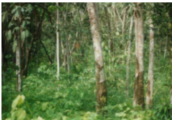
Gambar 4. Perkebunan karet rakyat yang kurang terpelihara. Jarak tanam yang tidak jelas dan pemeliharaan yang minim menyebabkan areal seperti “hutan karet”.

Bagaimanapun, jika hanya mengandalkan kemampuan petani, maka proses adopsi teknologi akan berjalan lambat akibat kekurangan modal. Kombinasi pendampingan kelompok tani berkelanjutan dan dukungan pemerintah berupa modal dan sarana produksi diyakini dapat mempercepat adopsi teknologi di tingkat petani karet. Jika mayoritas perkebunan rakyat dapat menerapkan kultur teknis yang baik, maka produktivitas karet nasional akan meningkat secara signifikan.