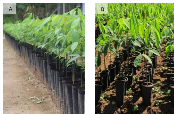
Gambar 2. A. Pembibitan karet langsung di polibag (Foto: Balit Sungei Putih, Puslit Karet), B. Pembibitan karet dengan root trainer (Foto: Balit Getas, Puslit Karet)

Bibit karet umumnya diperbanyak dengan metode stum okulasi mata tidur (SOMT). Kekurangan SOMT adalah tingkat kematian yang tinggi, terutama jika dikirim ke daerah yang jauh, dan perakaran yang kurang baik sehingga beresiko mengalami stagnasi dan kematian ketika dipindah ke lapangan (Siagian dan Bukit, 2015). Saat ini berkembang metode pembibitan langsung di polibag (Gambar 2A) untuk mendapatkan perakaran yang lebih baik (Siagian, 2012). Dengan metode ini, pembibitan sejak awal dilakukan di dalam polibag sehingga perakaran relatif tidak terganggu. Bahkan, teknologi root trainer (Gambar 2B) mulai diperkenalkan dengan menawarkan keunggulan proses pembibitan yang singkat, perakaran yang baik, dan kemudahan pengiriman (Ardika dan Herlinawati, 2014; Salisu et al. , 2016; Putra et al. , 2018).