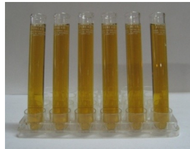
Gambar 3. Arang hayati dan asap cair TKKS.