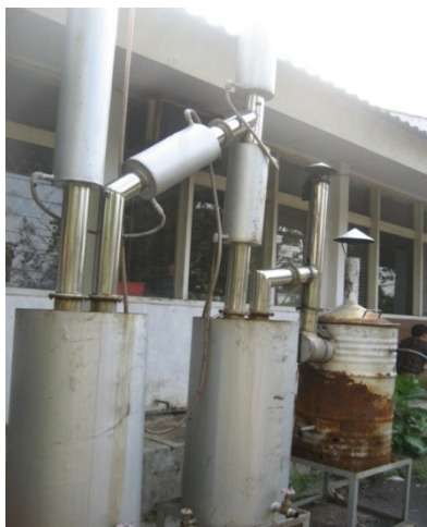
Gambar 1. Reaktor pirolisis TKKS menjadi arang hayati dan asap cair. Figure 1. Pyrolysis reactor to convert EFBOP to biochar and liquid smoke