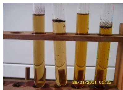
Gambar 4. Asap cair yang dihasilkan oleh kondensor pirolisis pada interval waktu 30,60,90 dan 120 menit. A) sebelum pengendapan dan B) setelah pengendapan semalam.